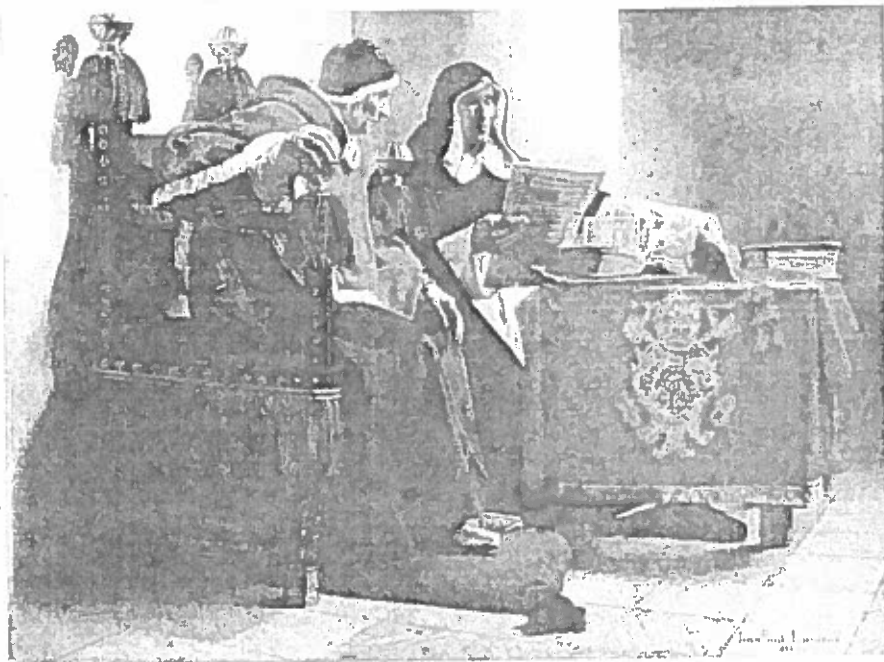
«Ο Πάπας και ο Ιεροεξεταστής», έργο του Γάλλου ζωγράφου Ζαν-Πολ Λοράν. Δεν είναι άγνωστη στην ευρωπαϊκή λογοτεχνία η παρουσία ενός Μεγάλου Ιεροεξεταστή.

παρακμή και εθίστηκαν σ' αυτήν και ουσιαστικά ερωτεύτηκαν την εκούσια δουλεία.